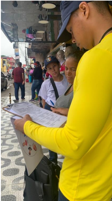
Cidade de Deus