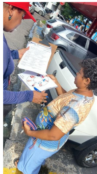
Nossa Senhora das Graças